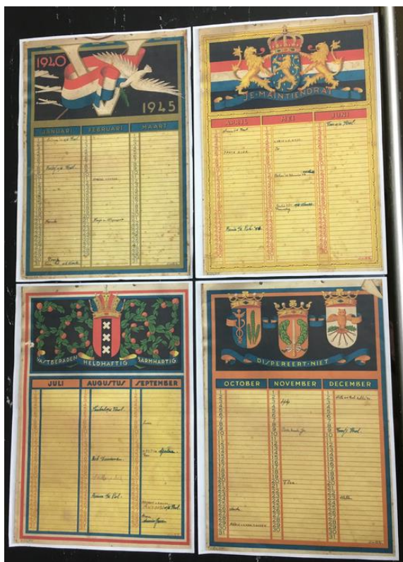
Figure 13 Birthday calendar