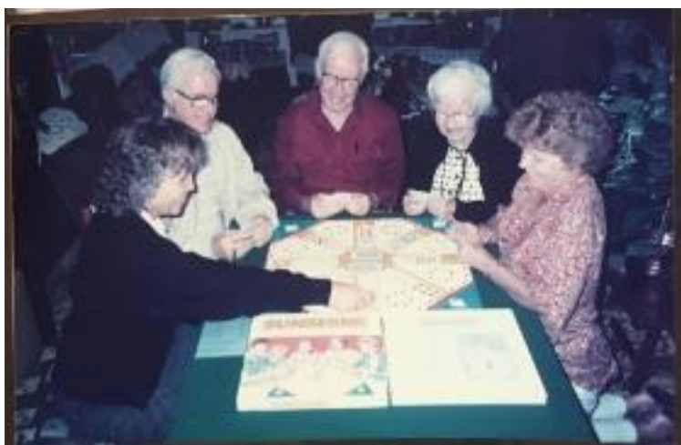
Figure 8 Playing the Sunshine Family Card Game with her children