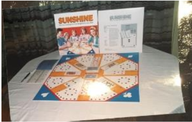
Figure 6 The Sunshine Family Card Game