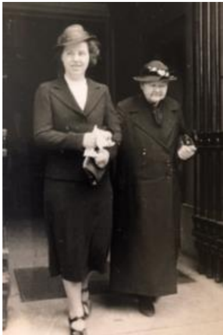
Figure 7 Sipkje with her grandmother