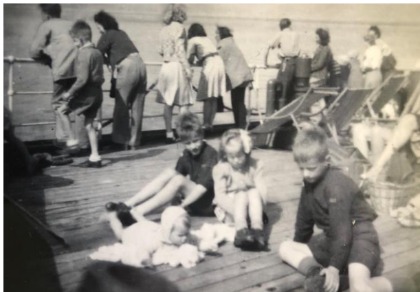
Figure 15 Sipkje's children on the Sibajak to Indonesia